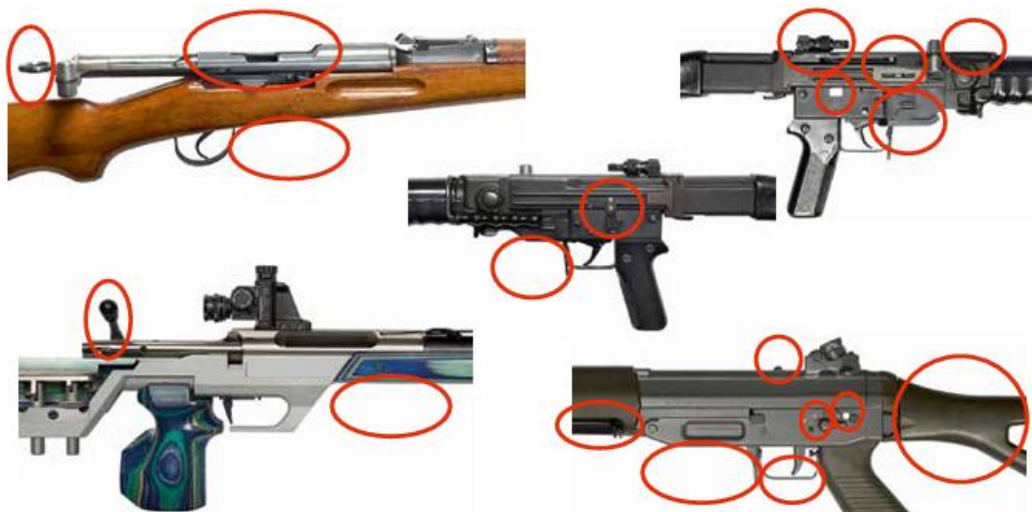
Stand am 01.01.2011